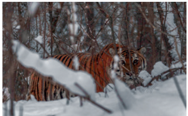
Der Sibirische Tiger – Seele der russischen Wildnis